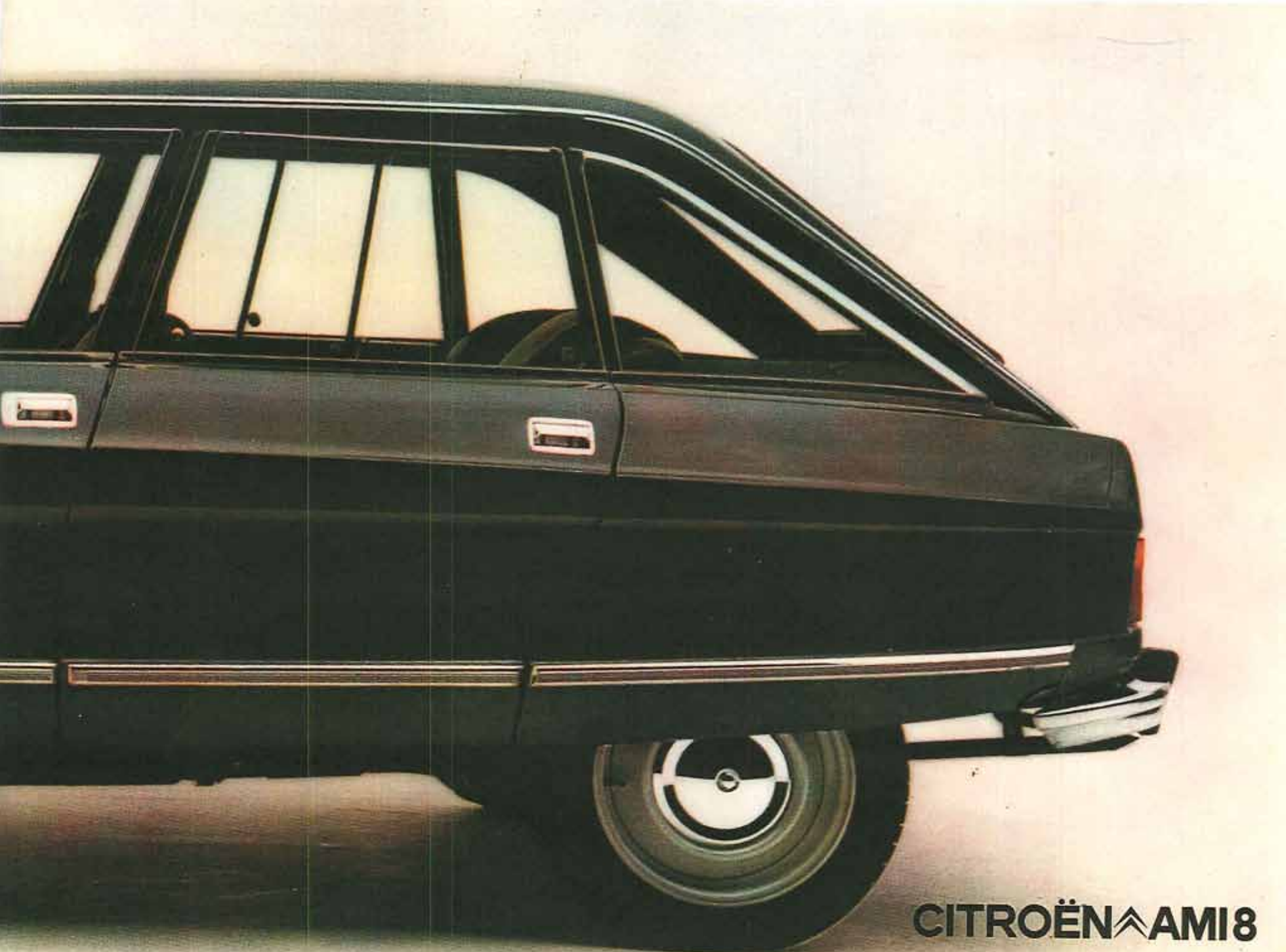
CITROËN ^ AMI 8