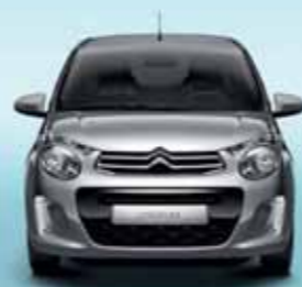
Grå Gallium (M)