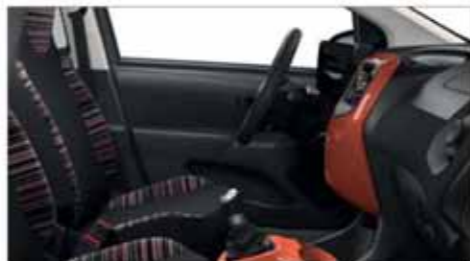
Tyg Zebra Rod* med Sunrise Red Colour Pack