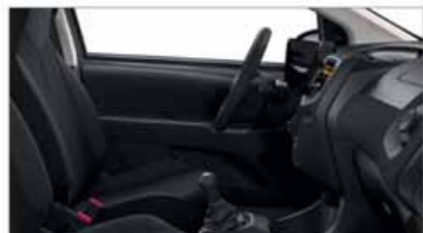
Tyg Grå Mica*