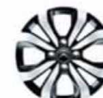
Lätmetallfälg 15" Planet