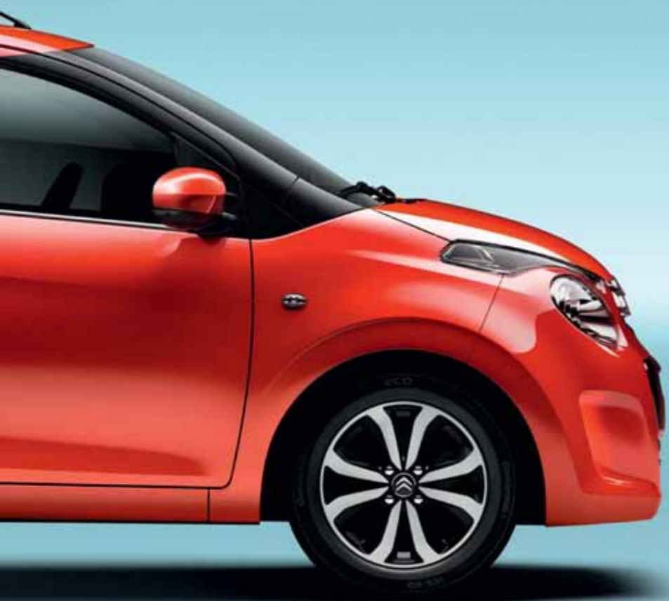
Röd Sunrise (S)