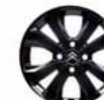
Lätmetallfälg 15" Planet Svart (biljs som tillbehör)