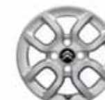
Lätmetallfälg 14" Magnet (biljs som tillbehör)