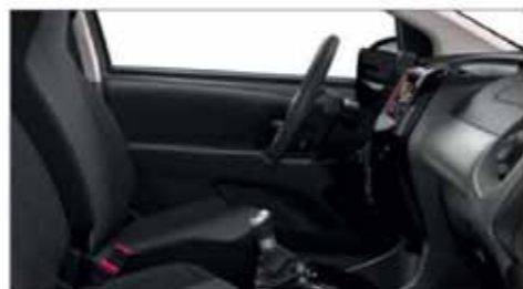
Tyg Grå Wave*