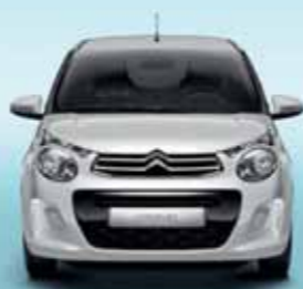
Vit Lipizan (S)