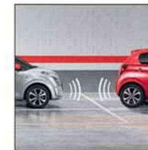
Parkeringshjälp fram och bak