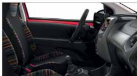
Tyg Zebra Light*