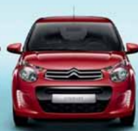
Röd Scarlet (S)

Nya Citroën C1 finns i åtta olika exteriörfärger: från den eleganta svarta "Caldera", de grå "Gallium" och "Carlinite" till "Brun Oliv", den vita "Lipizan", "Blå Smalt" och slutligen de röda "Scarlet" och "Sunrise". Eftersom detta är en modern