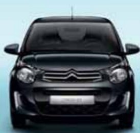
Grå Carlinite (M)