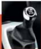
Sunrise Red Colour Pack