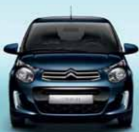
Blå Smalt (P)