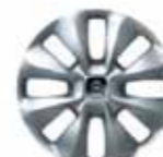
Hjulsida 15" Comet