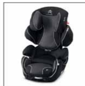
Barnstol Kidy Cruiserfix Pro