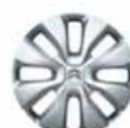
Hjulsida 14" Star