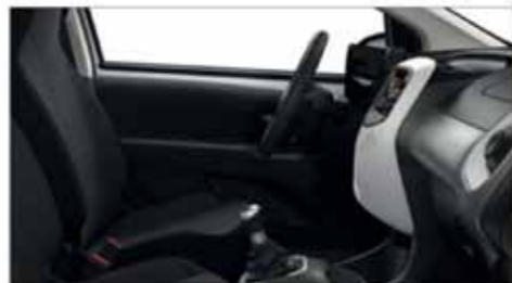
Tyg Grå Wave* med White Colour Pack