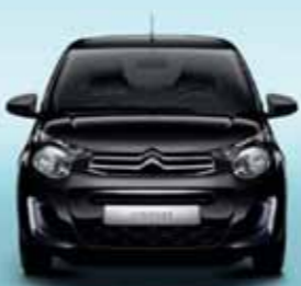
Svart Caldera (M)